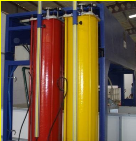
Cilindri di dosaggio brevettati Patented dosing cylinders Pistons de dosage brevetés

Thanks to its very high precision in metering and low capital investment, this is the ideal unit for the very easy and cheap production from 1 up-to 150 blocks in 8h shift (about 18-20ton/8h), for specialties or as a lab machine for testing and development of new formulas.